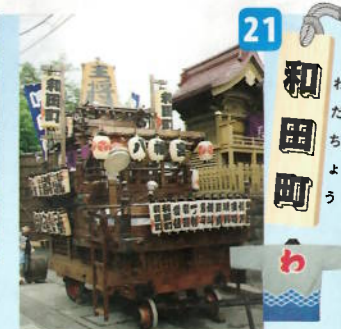
制作年：昭和二十八年 型：吉原雑壇型人形山車 出し：王将駒