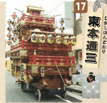
制作年：昭和三十四年六月 型：吉原雑壇型人形山車 出し：神明造社殿