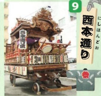
制作年：昭和三十三年六月 型：江戸型人形山車 出し：木之元神社殿