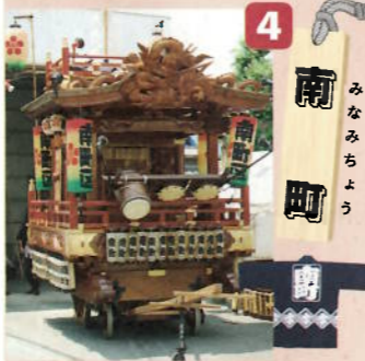
制作年：昭和五十九年十月 型：江戸型人形山車 出し：御幣