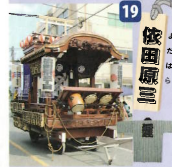
制作年：平成二十四年十二月 型：江戸型人形山車 出し：明神鳥居