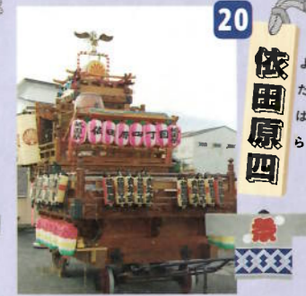
制作年：昭和二十八年六月 型：吉原雑壇型人形山車 出し：鳳凰・太鼓