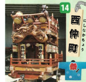
制作年：昭和三十三年六月 型：高欄型人形山車 出し：狸人形(分福茶釜)