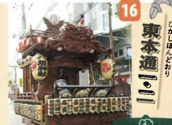
制作年：昭和三十年六月(令和三年改修) 型：江戸型人形山車 出し：御神鏡