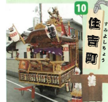
制作年：不明(昭和四十八年・平成十二年改修) 型：屋台型人形山車 出し：猿彦人形