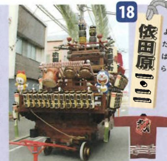
制作年：昭和二十九年 型：吉原雑壇型人形山車 出し：こけし人形