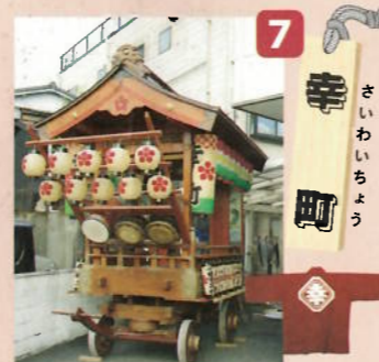
制作年：昭和三十年代(昭和六十三年・平成十七年改修) 型：舞台屋台