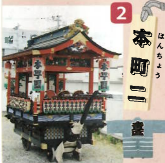
制作年：昭和九年二月(平成八年改修) 型：舞台屋台