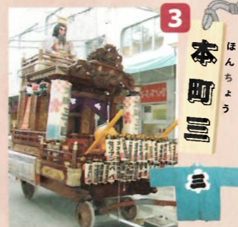
制作年：昭和二十九年六月 型：江戸型人形山車 出し：鐘撞人形