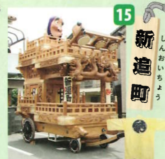
制作年：平成十二年六月 型：高欄型人形山車 出し：ひよっこ・おかめ