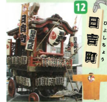
制作年：昭和十二年六月(昭和二十二年・六十年改修) 型：屋台型人形山車 出し：談鼓鑼