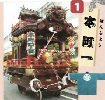
制作年：昭和十二年六月 型：江戸型人形山車 出し：天神社殿