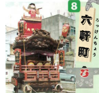
制作年：昭和三十年六月(平成二十三年改修) 型：江戸型人形山車 出し：金太郎人形