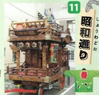
制作年：昭和三十一年 型：高欄型人形山車 出し：桃太郎人形