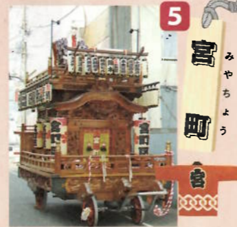
制作年：昭和十一年六月(昭和三十三年改修) 型：四輪高欄型人形山車 出し：鏡獅子人形