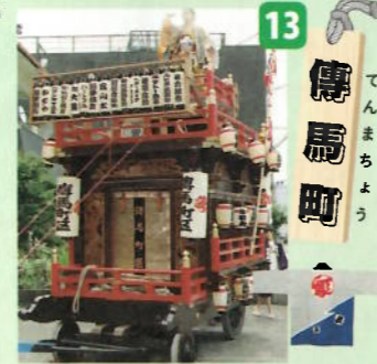
制作年：昭和三十三年六月 型：高欄型人形山車 出し：牛若丸人形