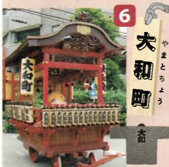
制作年：昭和九年二月(昭和三十六年改修) 型：舞台屋台